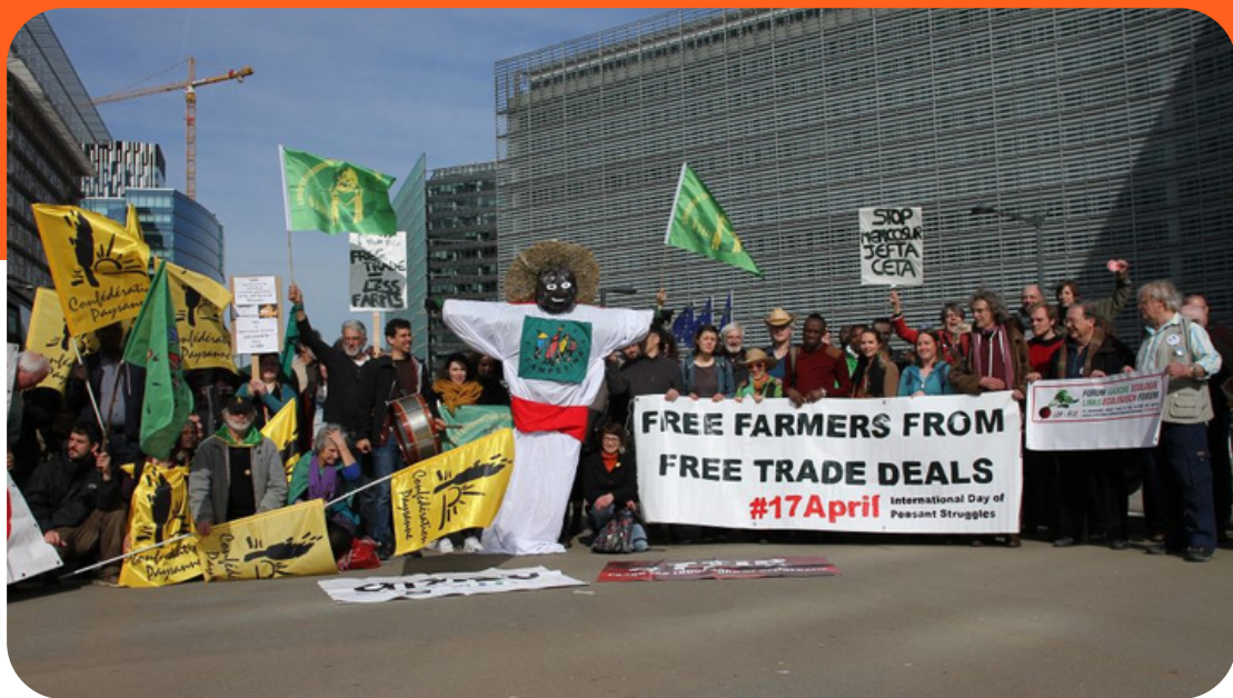
Mobilisation paysanne contre les accords de libre-échange devant la Commission européenne

La Commission européenne et plusieurs Etats-membres de l'UE souhaitent profiter de l'élection de Lula au Brésil pour ressusciter l'accord de libéralisation du commerce entre l'UE et les pays du Mercosur (Brésil, Argentine, Uruguay, Paraguay). Depuis 2019, ce projet d'accord avait de fait été gelé en raison de la mobilisation de la société civile dénonçant ses conséquences tant sur le plan écologique et social, qu'en termes de violations des droits humains, et en raison de la situation politique au Brésil. Mais le processus de finalisation et de ratification de l'accord devrait reprendre au premier semestre 2023.